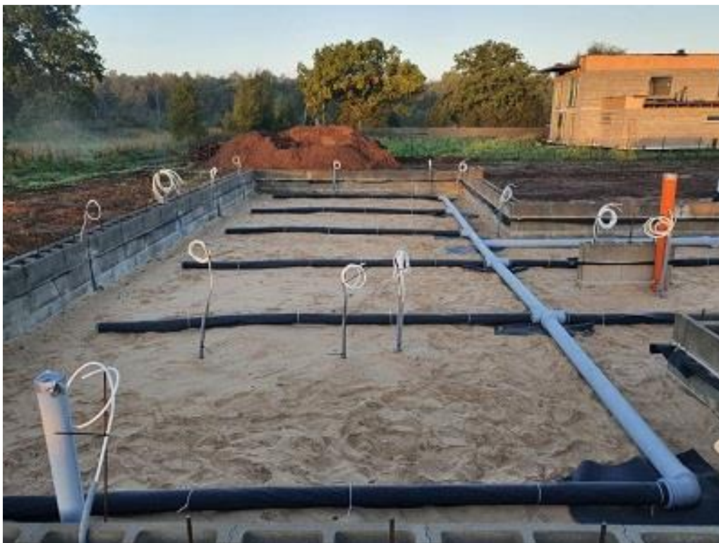
Foto 2. Radooni torustik ehitatav hoone tagasitäites.

Kõrgema radooni sisaldusega pinnaste puhul tasub alati meelde tuletada, et õigete meetmete kasutusele võtmisel püsib radoonitase siseruumides normi piires. Kõige esimeseks ja väga tõhusaks Rn-vastaseks meetmeks on meile kõigile hästi tuntud ruumide õhutamine!