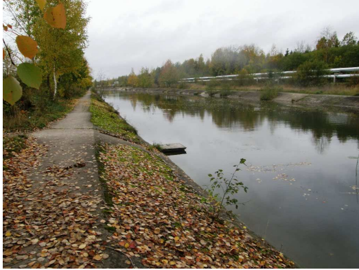
Foto 3.1 Vaade juurdevoolu kanalile

Lisaks vaata ka Lisa 2 Haljastuse hinnang.