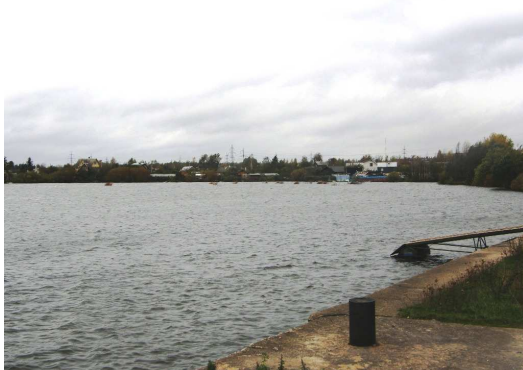
Foto 1.5 Vaade Veekulgu linnaosas paiknevatele väikeelamutele Kulgu sadamast