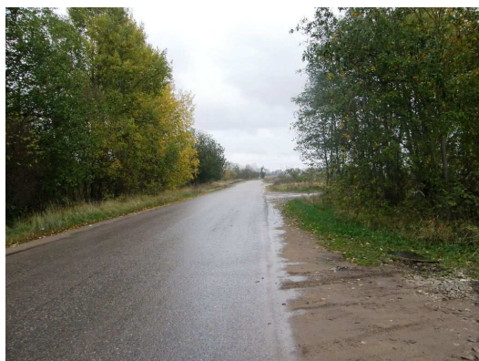
Foto 4.11 Vaade Tiigi tänavale Elektri- jaama teelt