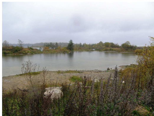
Foto 5.6 Vaade Väike-Kadastiku järvele kirde suunast