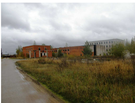
Foto 2.5 Vaade järjekordsele mahajäetud tööstuskompleksile Tiigi tänaval