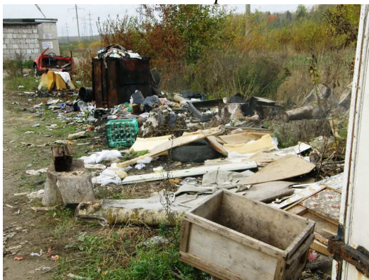
Foto 3.5 Vaade planeeringuala kagu pool asuvate garaažide vahel olevale prügihunnikule