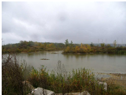
Foto 5.8 Vaade Väike-Kadastiku järvele kirde suunast