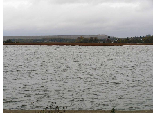
Foto 1.2 Vaade Balti soojuselektrijaama tuhaväljadele Kulgu sadamast