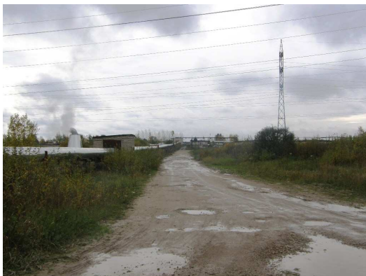
Foto 4.5 Vaade planeeringuala kagu osas paiknevatele garaažide juurdepääsule