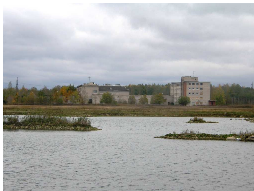
Foto 2.4 Vaade Kadastiku järve lõunapoolses osas asetsevale endise Energieetikute kooli kompleksile