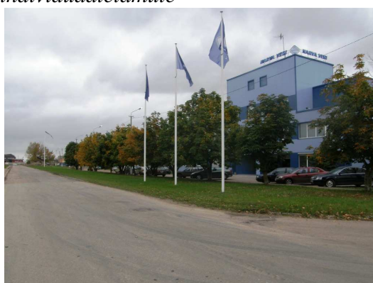
Foto 1.9 Vaade Narva Vesi AS-i hoonele Kulgu tänaval