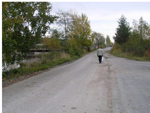
Foto 4.6 Vaade Kanali tänavale Elektri-jaama teelt