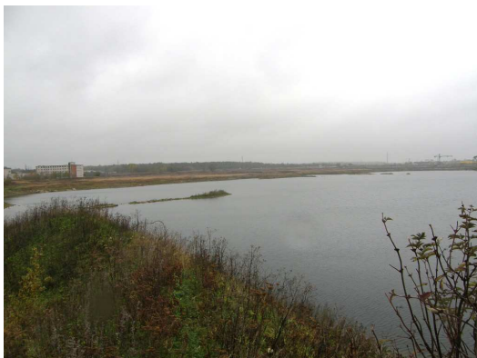
Foto 5.5 Väärtuslik vaade Kadastiku järvele kagu suunast