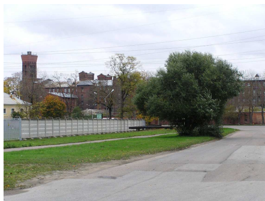
Foto 5.2 Väärtuslik vaade Kreemholmi manufaktuuri ajaloolisele kompleksile Kulgu tänavalt