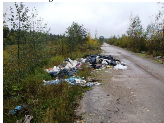
Foto 3.6 Vaade planeeringuala loode pool asuvale prügikogumiskohale