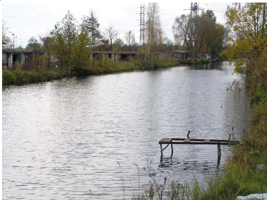
Foto 1.3 Vaade paadikuuridele Joala tänavalt