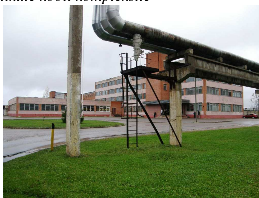
Foto 2.6 Vaade NAKRO nahavabrikule