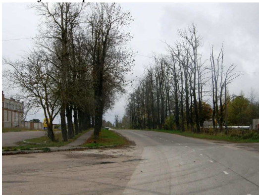
Foto 4.3 Vaade Joala tänavale kirde suunast