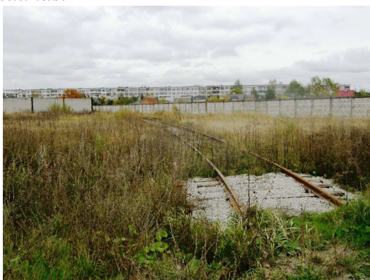
Foto 4.9 Vaade Kreenholmi haruraudteele