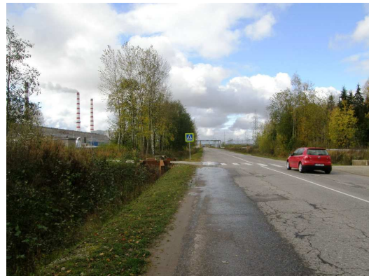
Foto 4.2 Vaade Elektri Jaama teele Rahu tänavalt