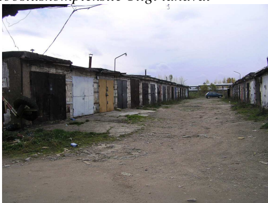
Foto 2.7 Vaade Narva tööstuspiirkonna lõuna osas paiknevatele garaažiühistustele