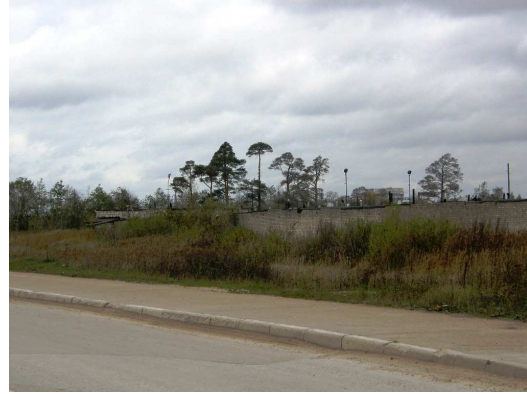
Foto 3.2 Vaade Kadastiku ja 1.Paemurru tänavate vahelisele haljasalale