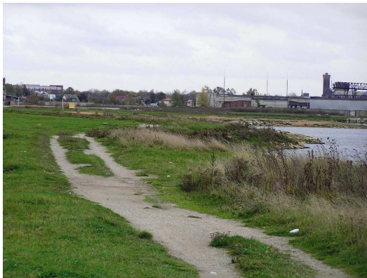
Foto 3.3 Vaade Kadastiku järve ümbruses arendatavale puhkealale