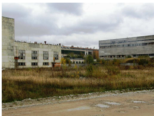
Foto 2.1 Vaade Narva tööstuspiirkonna mahajäetud tööstushoonete kompleksile