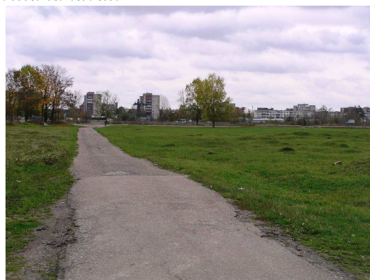
Foto 4.10 Vaade Kadastiku järve mööda jooksvale kergliiklusteele Kadastiku järve poolt