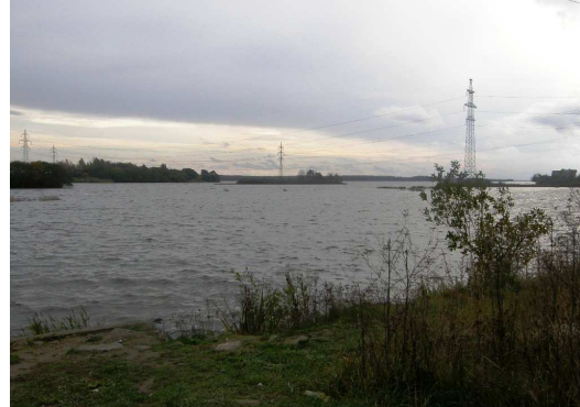
Foto 1.6 Vaade Königsholmi saarele Kulgu tammilt