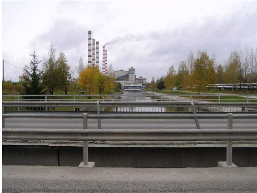
Foto 1.1 Vaade Balti soojuselektrijaama juurdevoolu kanalilt