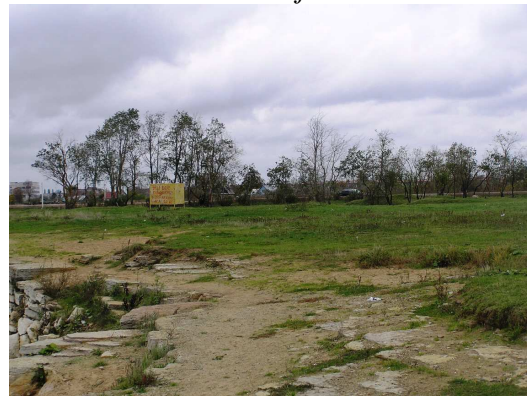
Foto 3.4 Vaade Kadastiku järve rannal asuvatele lagunenenud riietuskabiinile