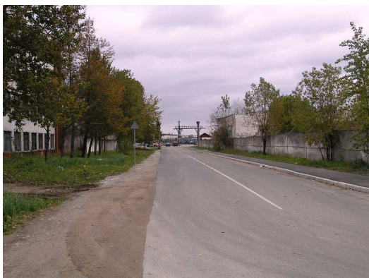
Foto 4.7 Vaade Kulgu tänavale kagu suunast