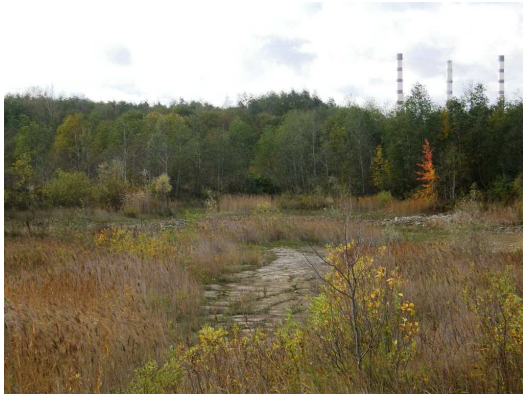
Foto 3.7 Vaade Narva lubjakivi maardla- le Kadastiku tänavalt