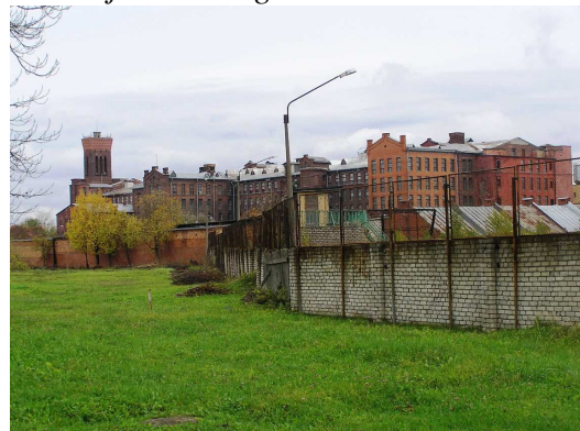
Foto 1.4 Vaade Kreenholmi manufaktuuri ajaloolisele kompleksile Joala tänavalt