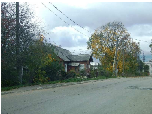
Foto 1.7 Vaade Kreenholmi linnaosas väikeelamupiirkonnas paiknevale individuaalelamule