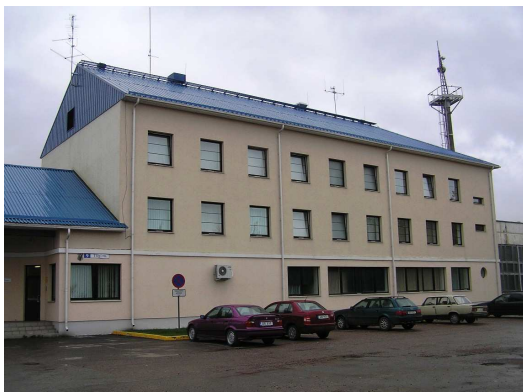
Foto 2.3 Vaade Tiigi tn 9 renoveeritud hoonele