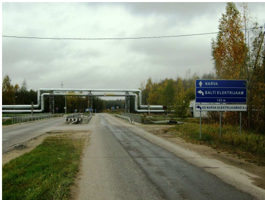
Foto 4.1 Vaade Elektri Jaama teele Balti elektri Jaama poolt