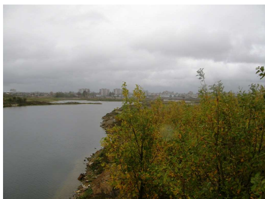
Foto 5.3 Väärtuslik vaade Kadastiku jär- vele edela suunast