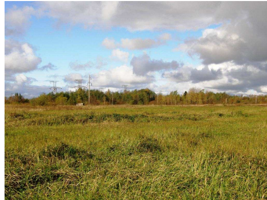
Foto 3.8 Vaade NAKRO nahavabriku ta- ga asuvale haljasalale