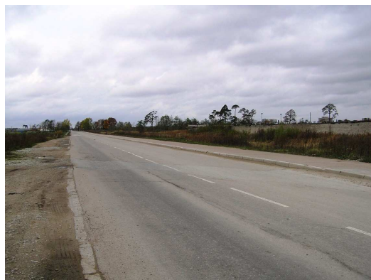
Foto 4.8 Vaade kadastiku tänavale Puu- villa tänavalt