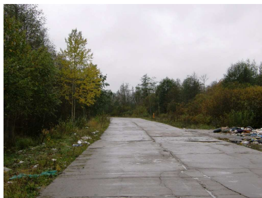
Foto 4.12 Vaade Kadastiku tänavale ida poolsele osale