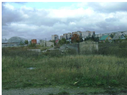
Foto 1.8 Vaade Kreenholmi linnaosas paiknevatele korterelamutele