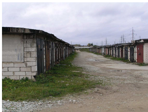
Foto 2.8 Vaade Narva tööstuspiirkonna lõuna osas paiknevatele garaažiühistustele