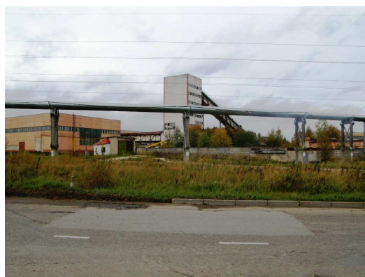
Foto 2.2 Vaade Joala tänaval asetsevatele tööstushoonetele