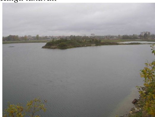
Foto 5.4 Väärtuslik vaade Kadastiku jär- vele lõuna suunast