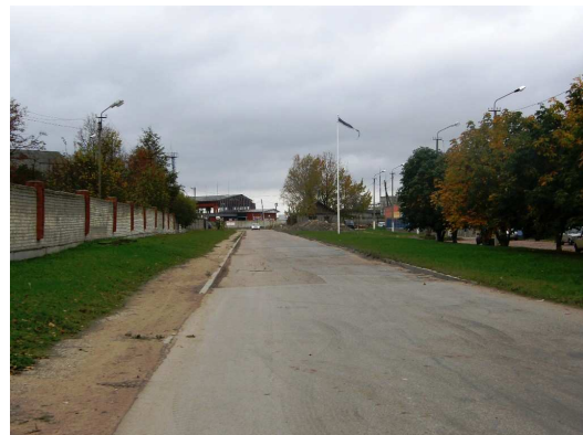
Foto 4.4 Vaade Kulgu tänavale Joala tänavalt