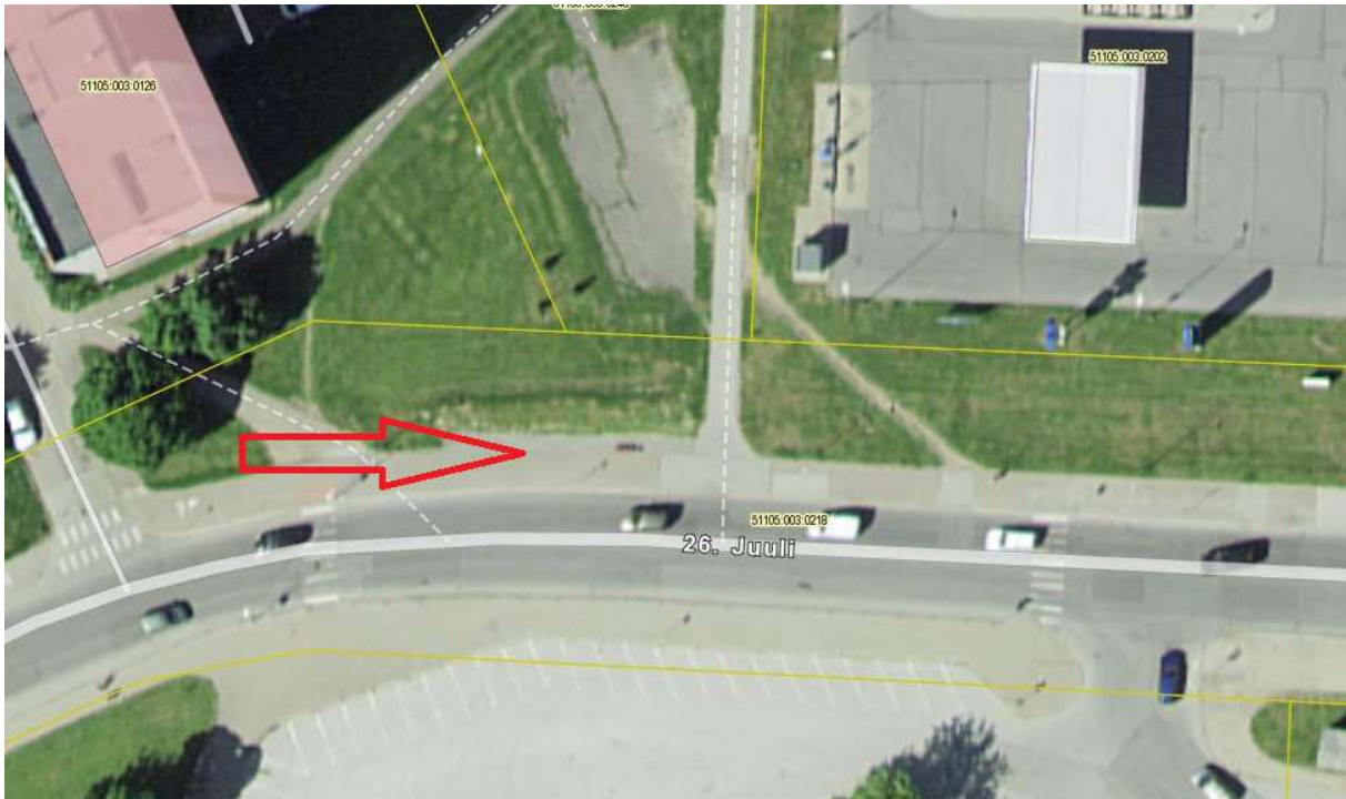
3. Bussiootepaviljon nr 3 (A-tüüpi): bussipeatus „Jäähall“ 26. Juuli tänav“, Narva linn, katastritunnus: 51105:003:0218