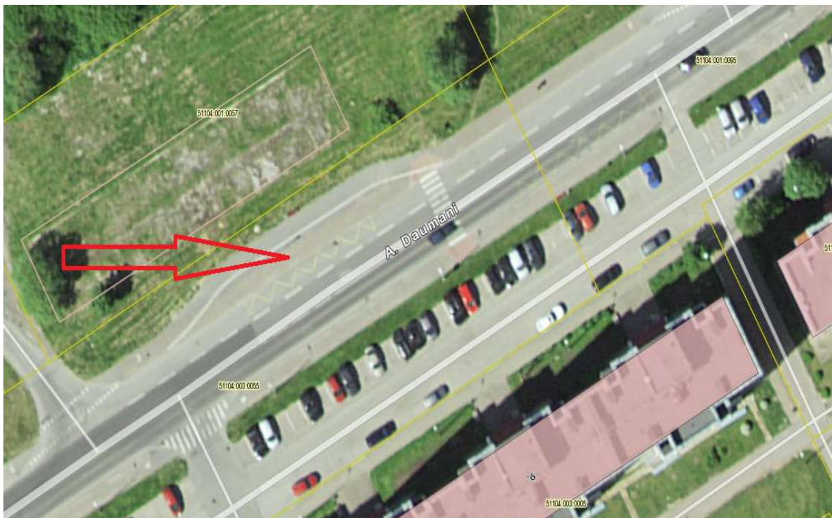
2. Bussiootepaviljon nr 2 (A-tüüpi): bussipeatus „Põhja“ A-Daumeni L1, Narva linn, katastritunnus: 51104:003:0055